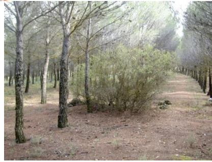
Detalle de punto de vegetación