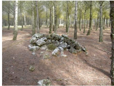
Detalle de cota (punto marrón)