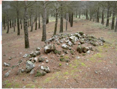
Detalle de cota

La cota marrón se ha utilizado para representar montones de piedras pequeñas y el triángulo negro de grupo de piedras se ha utilizado para montones de piedra más grandes que los representados con punto marrón, siendo estos más altos y/o más extensos o con piedras más grandes. Normalmente no se mezclan entre ellos, aunque sí hay puntos marrones al lado de triángulos negros, diferenciándose muy bien a la vista cual es uno y otro.