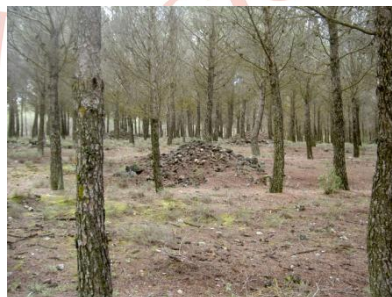
Cota (punto marrón)